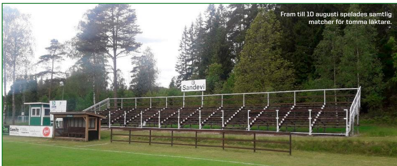
Fram till 10 augusti spelades samtliga matcher för tomma läktare.